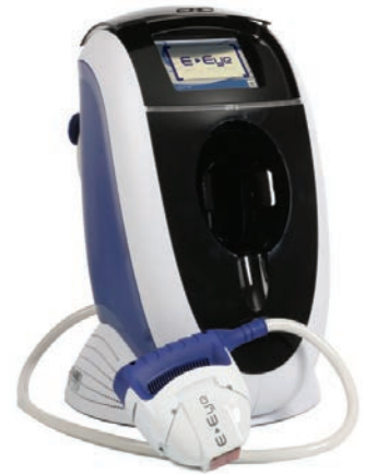
E-Eye – mobil und für jede Praxisgröße einsetzbar.

Das E-Eye ist die IRPL Technologie für die nachhaltige Behandlung des trockenen Auges. Das E-Eye-Gerät wird gezielt zur Behandlung der Meibomdrüsen-Dysfunktion (MGD) eingesetzt und ist als Gerät auf dem Markt dafür zertifiziert. Durch seine patentierte Pulslicht-Technologie mittels IRPL® (Intense Regulated Pulsed Light) liefert es einen langanhaltenden Behandlungserfolg von 86%. Die Behandlung dauert nur wenige Minuten, ist unkompliziert durchzuführen und führt zur Regeneration der Meibomdrüsen sowie zur sofortigen Stabilisierung des Tränenfilms. Das E-Eye bietet Ihnen sehr gute Abrechnungsmöglichkeiten bei geringem Investitions- und Personalbedarf.