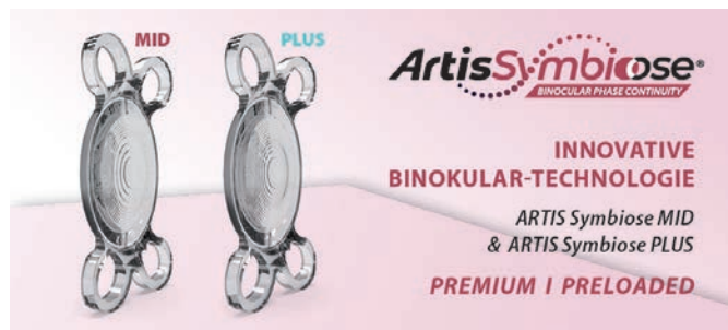
Artis Symbiose – zwei sich ergänzende Intraokularlinsen bilden ein perfekt aufeinander abgestimmtes trifokales System mit progressiver Tiefenschärfe