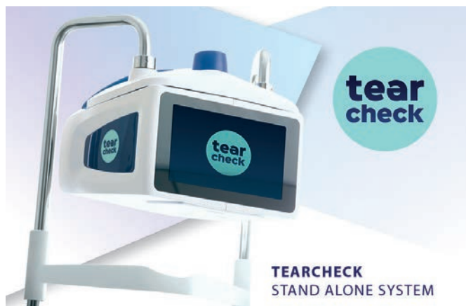
tearcheck® – festinstallierte Tischversion oder mobile Version wählbar. Im Lieferumfang sind ein Tablet und ein Drucker enthalten.

Das tearcheck® setzt weltweit neue Maßstäbe in der Tränenfilmanalyse durch zwei komplett neue Untersuchungen und seiner einzigartigen Anwendung mit Touchscreen Display. Die TFSI® (Tear Film Stability Evaluation) untersucht den gesamten Tränenfilm und bewertet hier die tatsächliche Tränenfilmstabilität. Die OSIE® (Ocular Surface Inflammatory Evaluation) zeigt die Zonen auf Sklera und Conea, welche besonders anfällig für Entzündungen durch trockene Augen sind. Zwei hochauflösende Kameras visualisieren die morphologischen Veränderungen des Drüsengewebes in einer 3D-Meibographie. Alle Untersuchungsergebnisse werden (bzw. können) kabellos übertragen und ausgedruckt werden. Im Lieferumfang sind ein Tablet und ein Drucker enthalten.